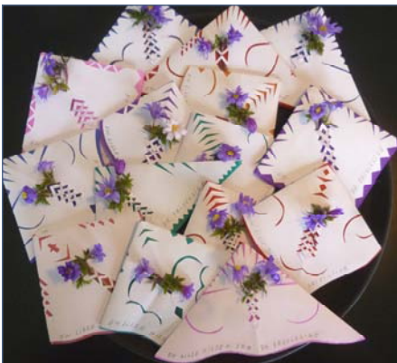
Gækkedevote til patienterne, lavet af frivillige hænder.

Det at have frivillige tilknyttet Hospice Djursland så vi som en hel naturlig del af hele det tanke-sæt, der ligger bag etableringen af et hospice. De hører med som en væsentlig del af den hverdag, vi forsøger at etablere i huset. De frivillige er med til at skabe atmosfære og liv, og de tilbyder sig som et medmenneske med tid og overskud til at være med til at gøre en forskel.