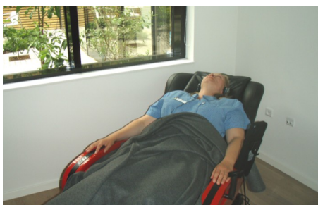
Massagestolen, hvor de pårørende og ansatte kan nyde et hvil.

Frivilligkoordinatoren og de frivillige har fået en bærbar computer og Hospicet et digitalt kamera.. Ekstra udstyr til det spabad, som Støtteforeningen forærede Hospicet