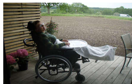
Kørestolen til udendørs brug.