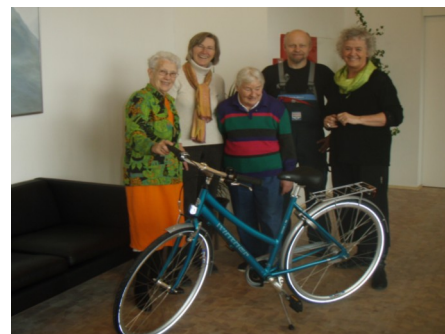
Cykel fra HN Cykelcenter til de pårørende.