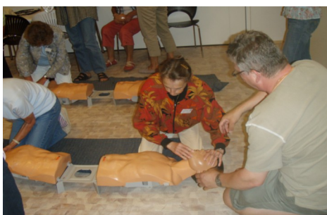
Førstehjælpskursus for de frivillige på Hospice Djursland.

Udendørshold, der bl.a. sørger for, at køkkenet får eget krydderurtebed. Vågekonerne, der arbejder på grundlag af en samarbejdsaftale/projektbeskrivelse lavet af Frivilligt Udvalget. Vært/værtinder ved hovedmåltiderne. Besøgsvenner og ledsagere. En enkelt frivillig til stede flere eftermiddage om ugen for at stå til rådighed som medmenneske. Biblioteks- og blomsterpasning. Hjælp ved gudsstjeneste. Assistance ved andre arrangementer.