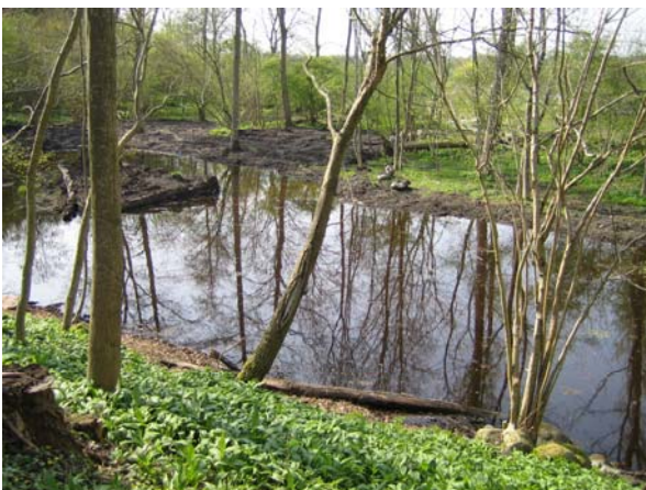
Her er søen, som den tager sig ud på en smuk forårsdag i april.