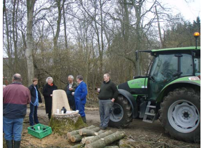
En fortjent kaffepause til de hårdtarbejdende "skovarbejdere" i remisen.

skovbunden udvikler sig nu, da der er kommet lys ind. Måske kan der nå at blive etableret andefamilier i forbindelse med søen?