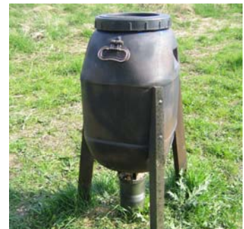
Foderautomat til råvildtet.

Hospicegrunden er på ca. 9 ha., hvoraf ca. 6 ha. er den store vildtremise og et græsareal. Støtteforeningen sørger for driften af disse 6 ha. på grundlag af planer, som Hospicebestyrelsen har godkendt. Det er målsætningen, at området skal være en oase for patienterne, disses pårørende og dyrelivet. Arbejdet udføres i udstrakt grad af frivillige. Nu og da er der brug for entreprenørhjælp, f.eks. i forbindelse med anlæg af stier og for nyligt restaurering af den lille sø. Økonomien bag er en testamentarisk gave fra en anonym person, som netop ønskede at støtte udbygningen af arealet som oase.