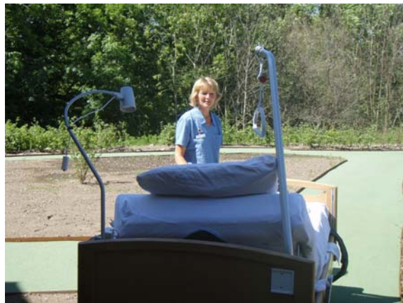
Stierne omkring Hospice Djursland er anlagt, så det er muligt for patienterne at nyde naturen fra deres seng.