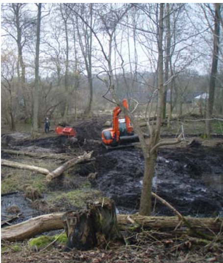
Og ja, der var en sø!

Jamen, er der en sø her? Det er den bemærkning, vi oftest hører, når vi går og rydder op i Remisen vest for Hospice Djursland. Og ja, der var en næsten tilgroet sø (vandhul), og den er nu ryddet op, og vi håber, at vi kan få et mere permanent vandspejl til gavn for dyrelivet i området og til fryd for øjet.