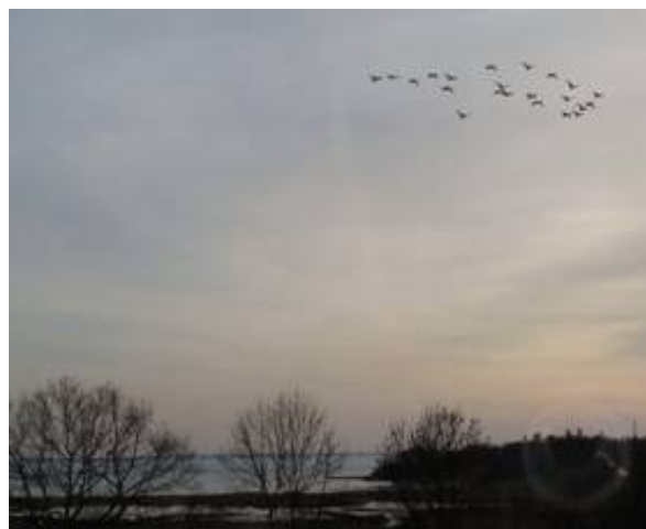
21 gæs på træk i aftenkumringen over Følle Bund.

helt op på terrassen. Der har været bogfinker, blåmejser, musvitter, grønirisk og et par stykker mere, som jeg ikke har fået identificeret endnu. Desuden har jeg en lille mus, der kommer på besøg udenfor for at spise - det er da vældig hyggeligt.