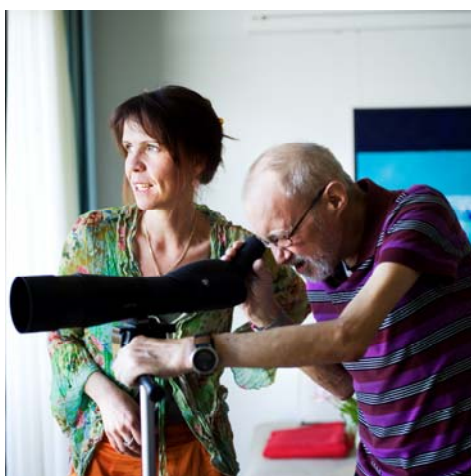
Udelivet studeres flittigt i kikkerten.